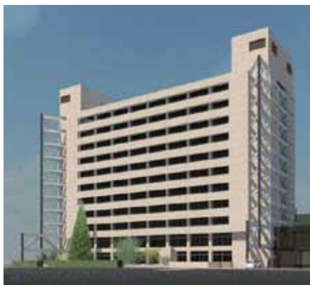
本庁舎耐震補強工事H28~完成予定:H30年度末頃