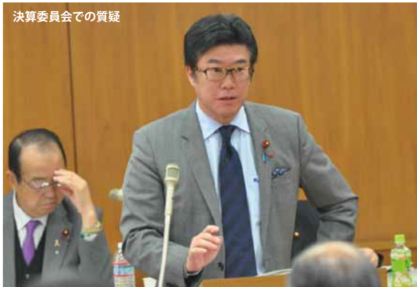
決算委員会での質疑

自由民主党さいたま市議会議員団の平成28年度予算編成に対する要望に対して、全ての項目に予算が付き、事業にも検討が加えられました。・・・しかし