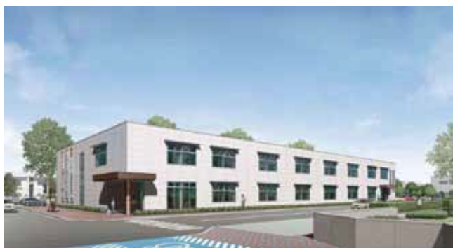
仮配置棟(北側) 完成予定:H28.10頃