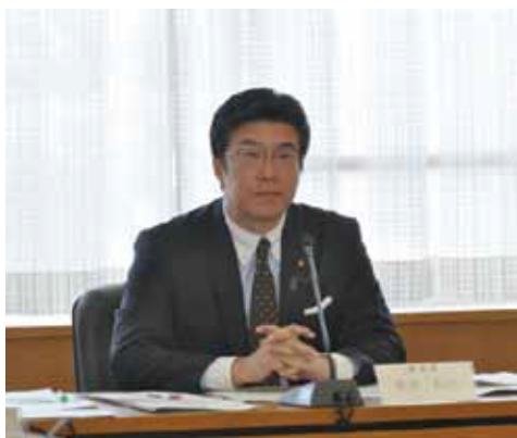
(文教委員長として慎重審議をしました)