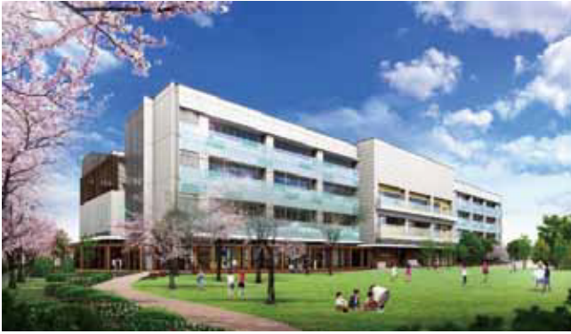
さいたま市浦和区上木崎4丁目50番1(旧大原中学校跡地)

子ども、家庭、地域の子育て機能を総合的に支援する、さいたま市らしさを生かした中核施設を整備します