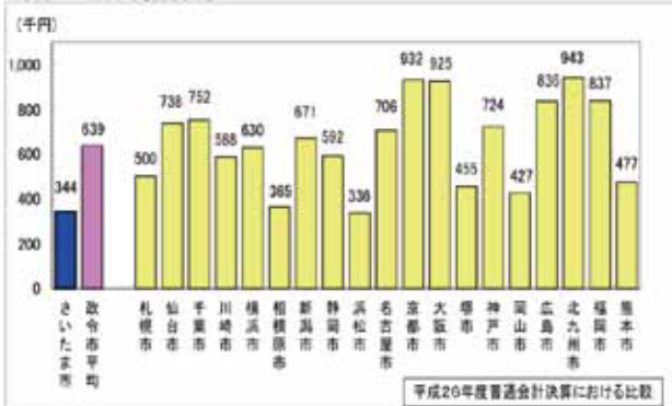
<市民一人当たり市債残高比較>